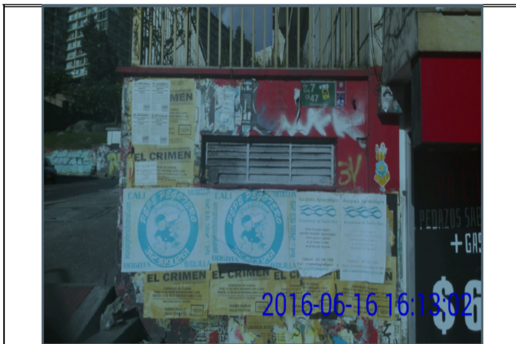
Fotografía No. 1. Elementos instalados en Espacio Público. Operativo en la Localidad de Chapinero, día 16 de Junio de 2016-Esquina Avenida carrera 7 con calle 47.

Registro fotográfico, Operativo de Control efectuado el día 16/06/2016 en la AVENIDA CARRERA 7 CON CALLE 47